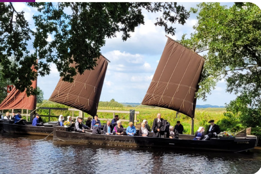
Torfkahngottesdienst an der Hamme