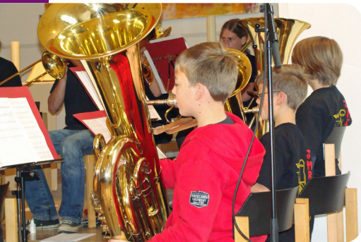
Jungbläser bei der Probe

Neugierig geworden? Wir sind Antworten schuldig geblieben? Hoffentlich!