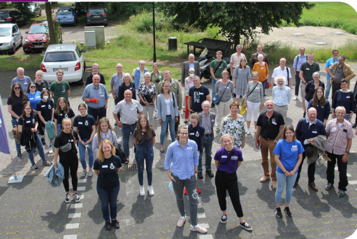
Akteure unserer Zukunftssynode

Wir freuen uns über Ihre Mitwirkung am vielfältigen gottesdienstlichen Leben in Osterholz-Scharmbeck und im Kirchenkreis.