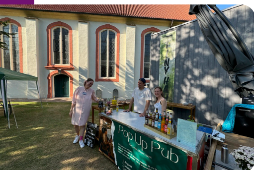
Pop-Up Café der Kirchenkreisjugend