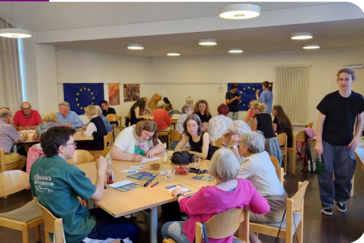
Demokratie-AG in Lilienthal