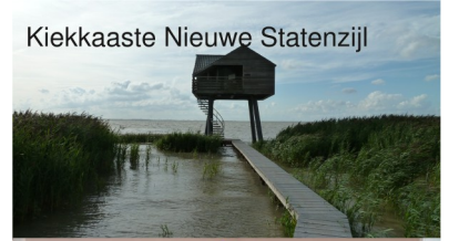
Kiekkaste Nieuwe Statenzijl

Bitte senden Sie Ihre Bewerbung per E-Mail an das Landeskirchenamt der Ev.-luth. Landeskirche Hannovers: Personaldezernat@evlka.de