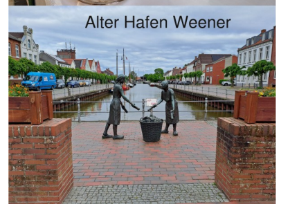
Alter Hafen Weener