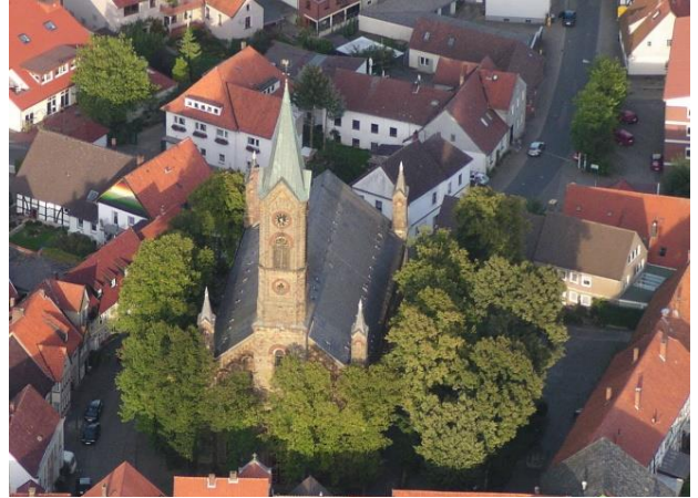
Ev.-luth. St. Martini-Kirche Buer