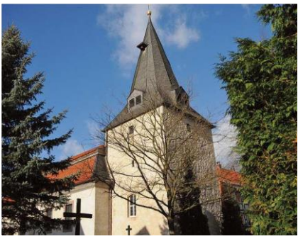
Kirchen in Almstedt, Möllensen und Petze.