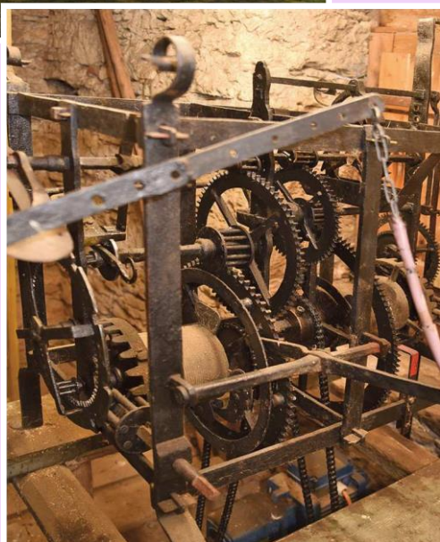
Fotos: Kirchenglocke in Möllensen.