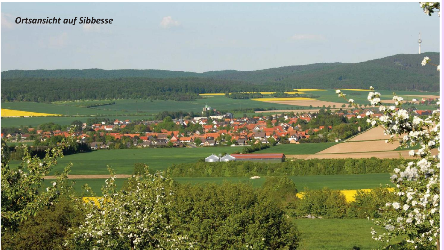
Ortsansicht auf Sibbesse