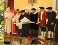
Luther - Spektakel